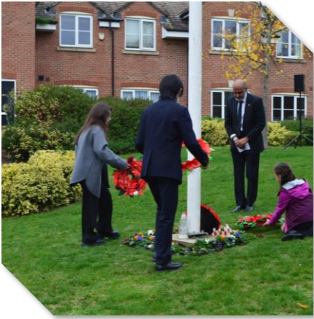
Remembrance Day 花を手向ける

編集後記 サマータイムも終了し、夜が長くなりましたがハロウィーンやクリスマスなど秋から冬にかけて楽しいイベントが満載の季節です。(高野)