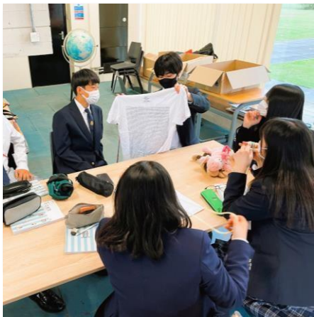
先輩たちが残してくれた服、 どう使おうか?!